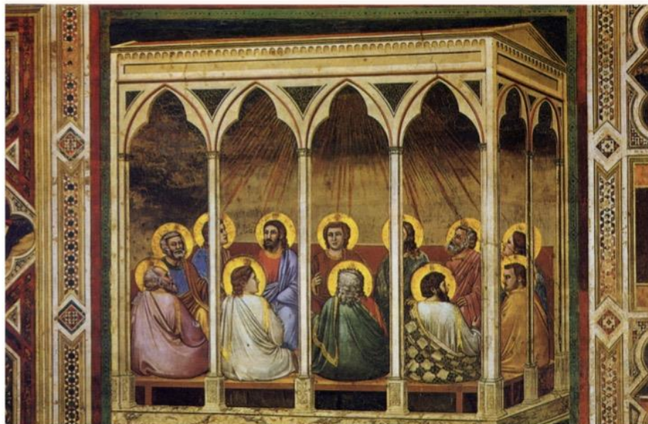
Giotto, Pentecoste, 1303-1305, affresco, Cappella degli Scrovegni, Padova